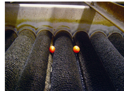
Resto de producto con pared lateral sucia

El higiene y la limpieza eficaz reducirá la probabilidad de la contaminación cruzada en los productos, con organismos que puedan dañar los equipos así como presentar un riesgo de salud para los seres humanos. Highland Fresh Technologies se complace en ofrecer una variedad de productos, sistemas de aplicación y métodos de verificación para cumplir con los retos de limpieza de equipos en la industria de producción de alimentos.