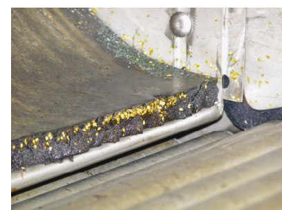
Semillas salidas de producto roto, adheridas al equipo